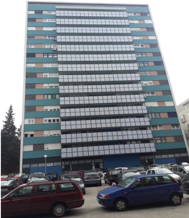
Slika 1. Visoki objekt na adresi Jobova 1

Vježba će se održati u krugu građevine na adresi Jobova 1.